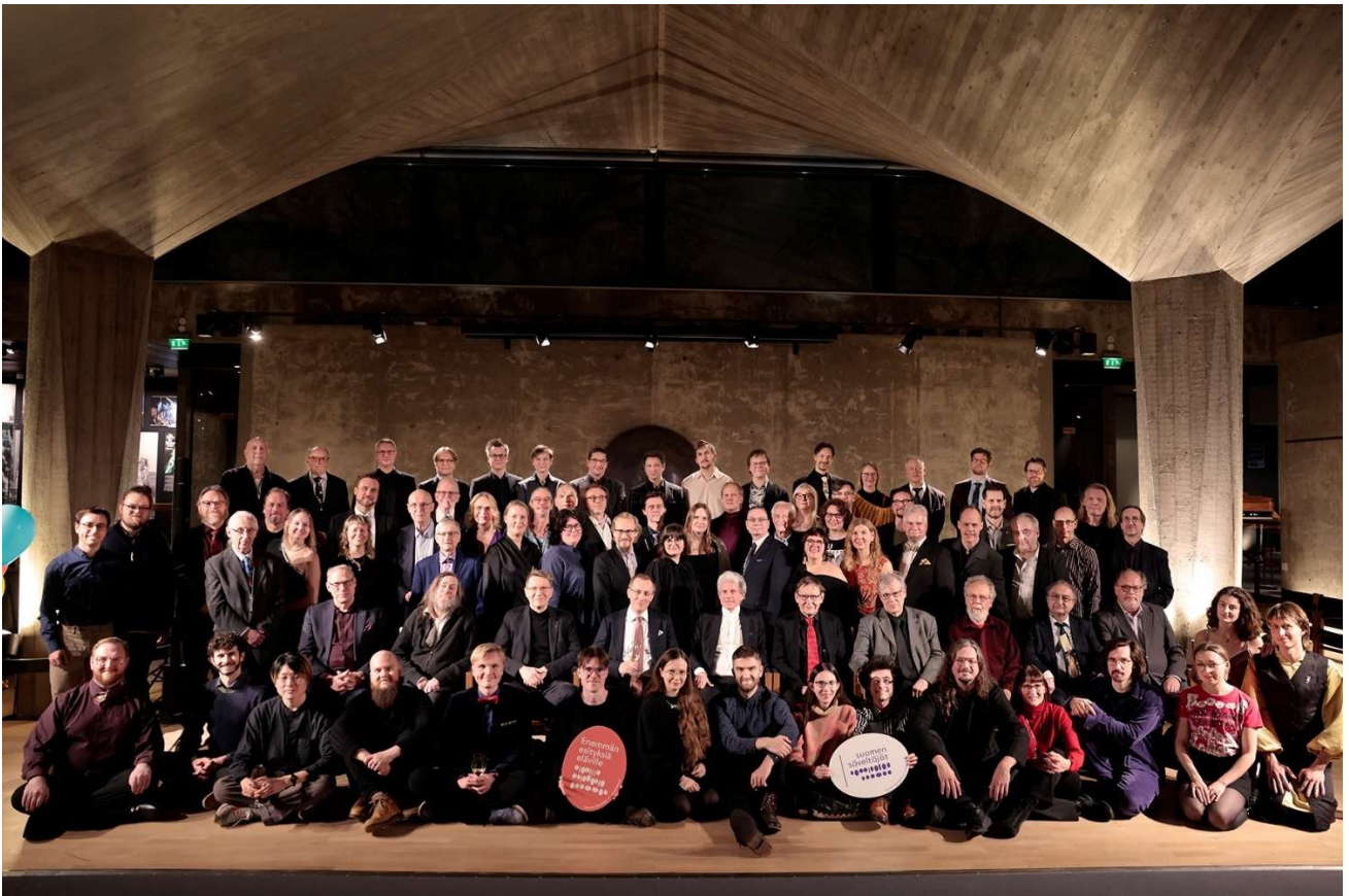
Suomen Säveltäjien jäsenten yhteiskuva Turun Sibelius-museossa 20.11.2025

Yhdistys on perustettu 15.10.1945, ja se vietti toimintavuonna 80-vuotisjuhlavuottaan. Merkivuotta juhlimaan innostettiin mukaan laajasti toimijoita taidemusiikin kentältä. Näin pääsimme välittämään myös laajemmalle yleisölle viestimme: ”Enemmän esityksiä eläville!”. Jo 80-vuotiaan Suomen Säveltäjät ry:n jäsenistö koostuu omaäänisestä, luovasta joukosta, joka kertoo musiikillaan ajastamme tässä ja nyt. Toisaalta kartoitimme ja hyödynsimme vuoden aikana yhdistyksen arkistoja arkistoprojektissa sekä tarkastelimme omaa historiaamme viime vuosikymmenien ajalta.