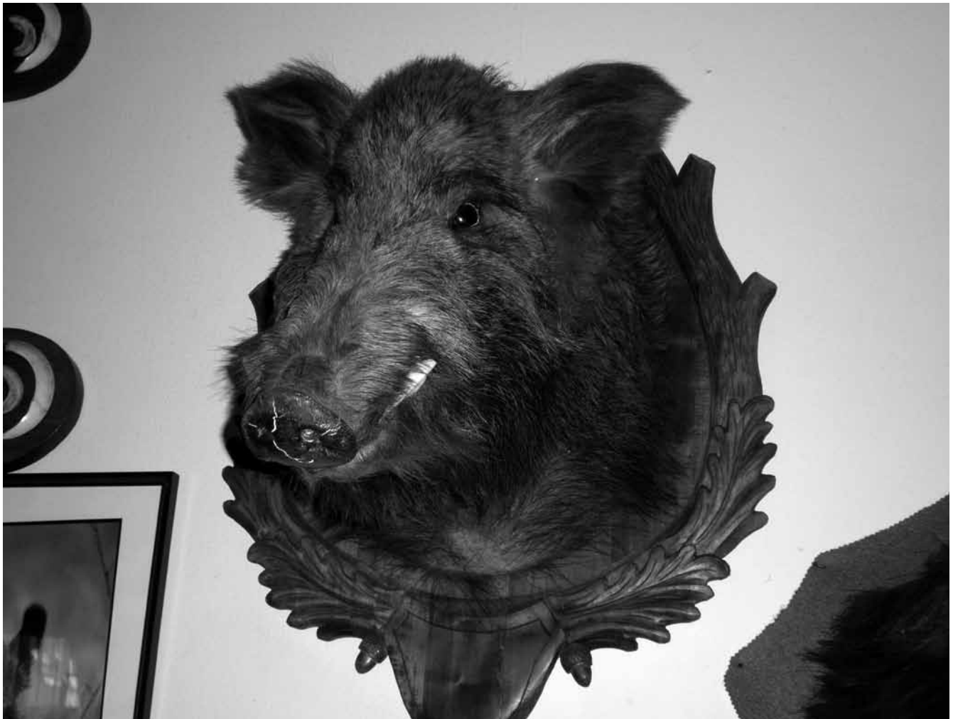
Hotellin loppuun asti mietittyä sisustusta.

sen vaikeaa päästä. Konserttipaikka, sokeain koulu, oli kauttaaltaan lukittu hyvissä ajoin ennen konsertin alkua. Päästyämme viimein talonmiehen avustuksella sisään tuplasimme helposti yleisömäärän noin kahteenkymmeneen. Decsény kertoi toimineensa Unkarin elektroakustisen studion johtajana kahdenkymmenen vuoden ajan. Yksi konsertin positiivisista elämyksistä olikin hänen nauhateoksensa Kivet vuodelta 1987. Teoksessa säveltäjä oli jäsentänyt konkreettisia ääniä sekä erilaisia äänisynteesejä selkeiksi jatkumoiksi. Konsertin toinen nauhateos Konsertto vuodelta 2005 olikin kummallisempi konstruktio. Teos pohjautui säveltäjän vuonna 1976 kantaesitettyyn pianokonserttoon. Itse pianokonserttoa ei kuitenkaan kuultu vaan kuulokuvaan syötettiin orkesterin jousiston viritystilanne ennen konserttia sekä erilaisia