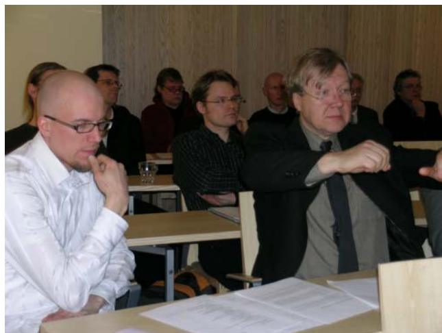
Säveltäjä Länsiön kokousvoimistelutuokio, jota säveltäjä Auvinen selvästi ei ole huomaavinaan.